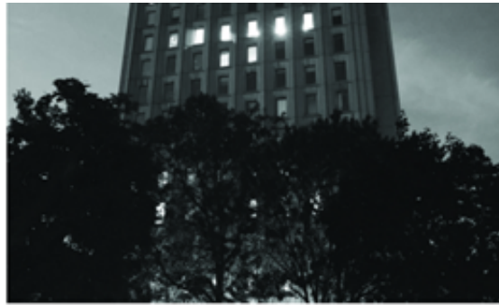
Desiree Ong / The McGill Tribune